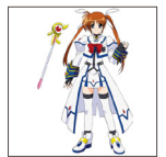
魔法少女リリカルなのは