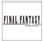
ファイナルファンタジー